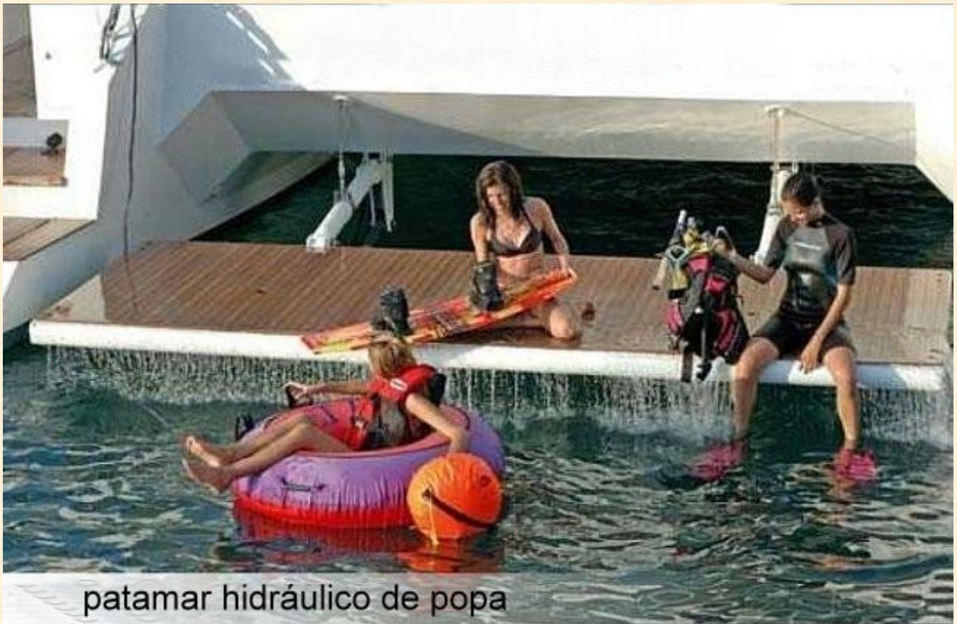
patamar hidráulico de popa