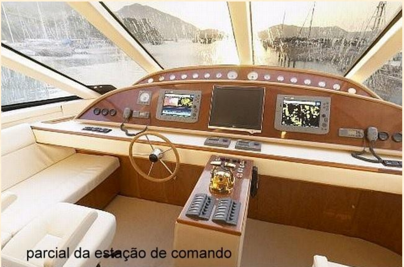
parcial da estação de comando