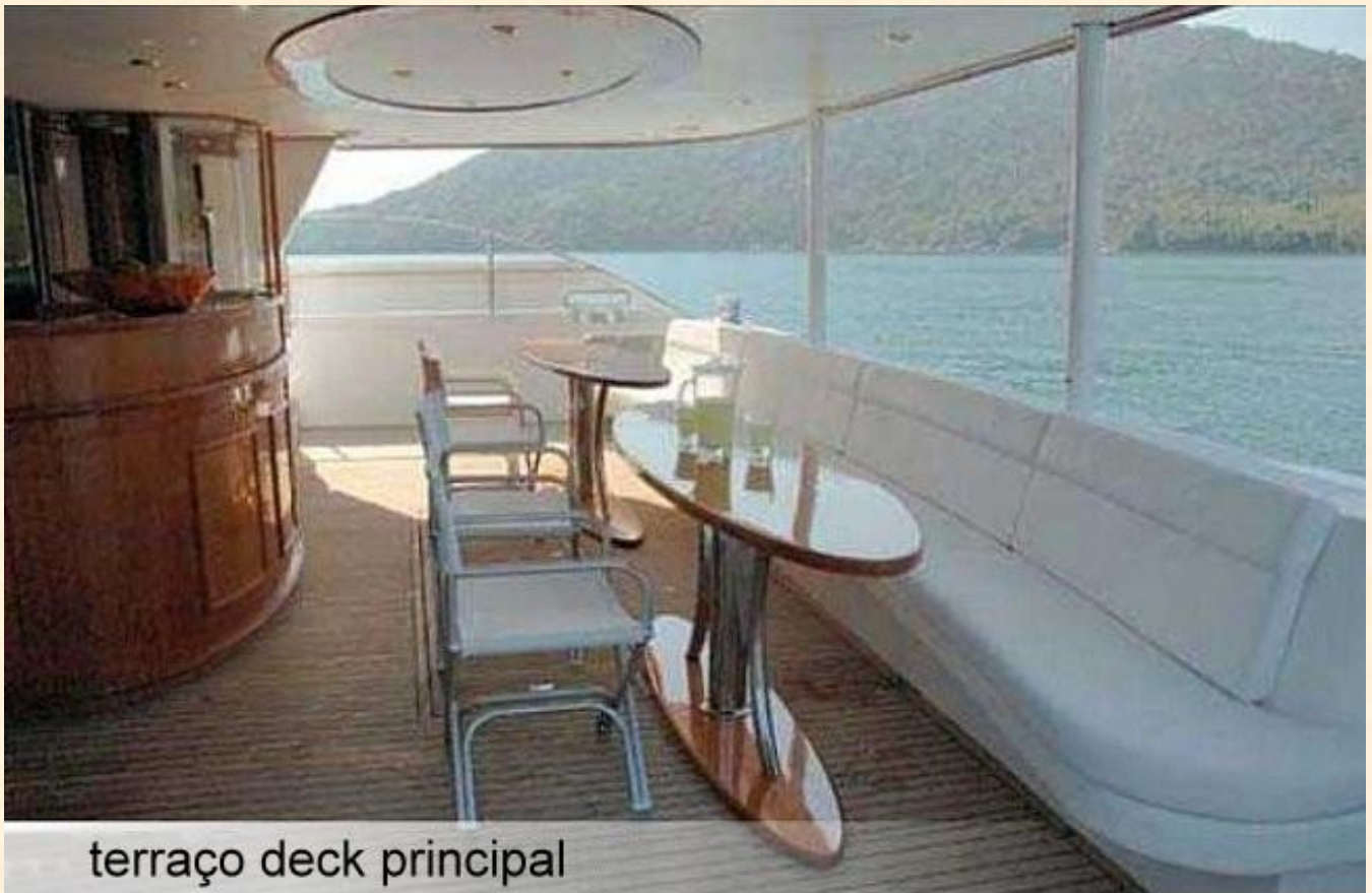
terraço deck principal