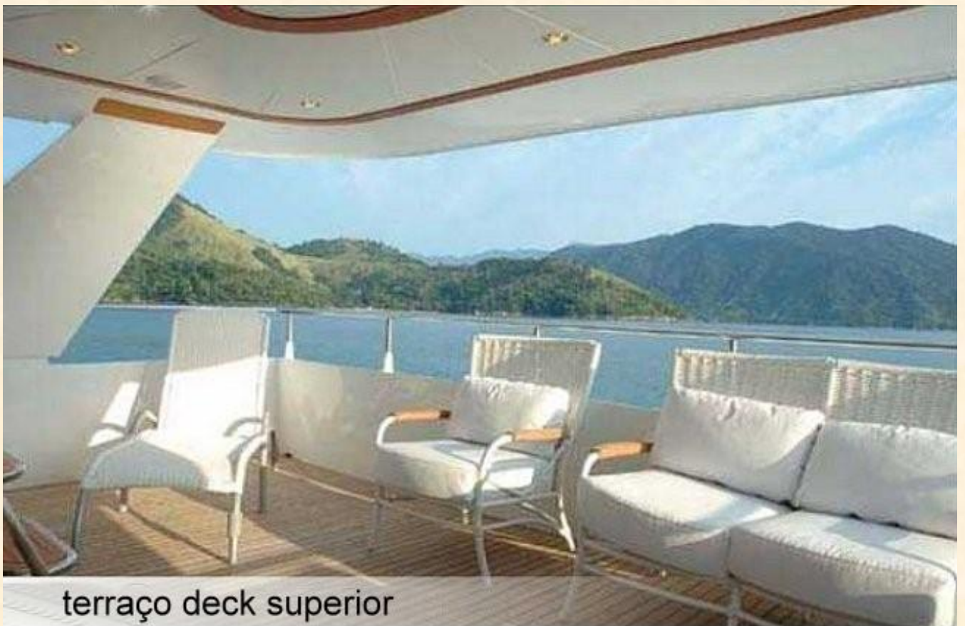
terraço deck superior