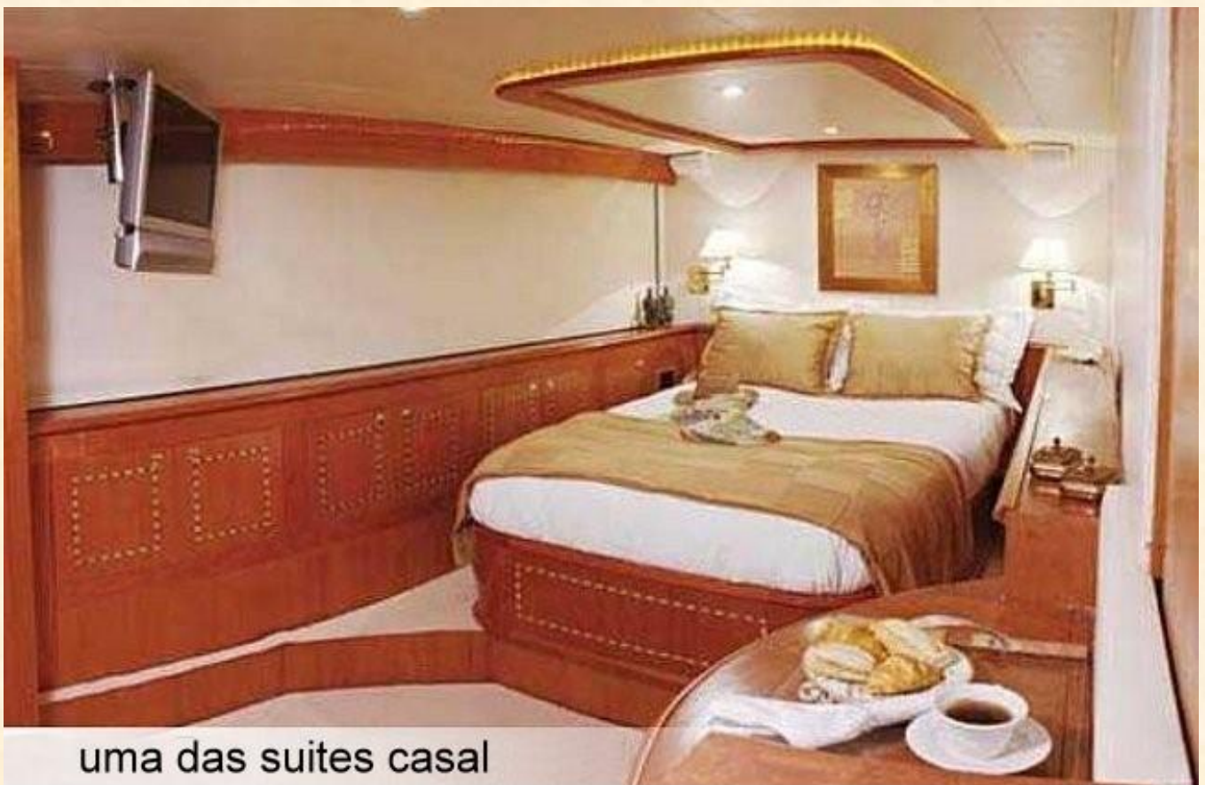
uma das suites casal