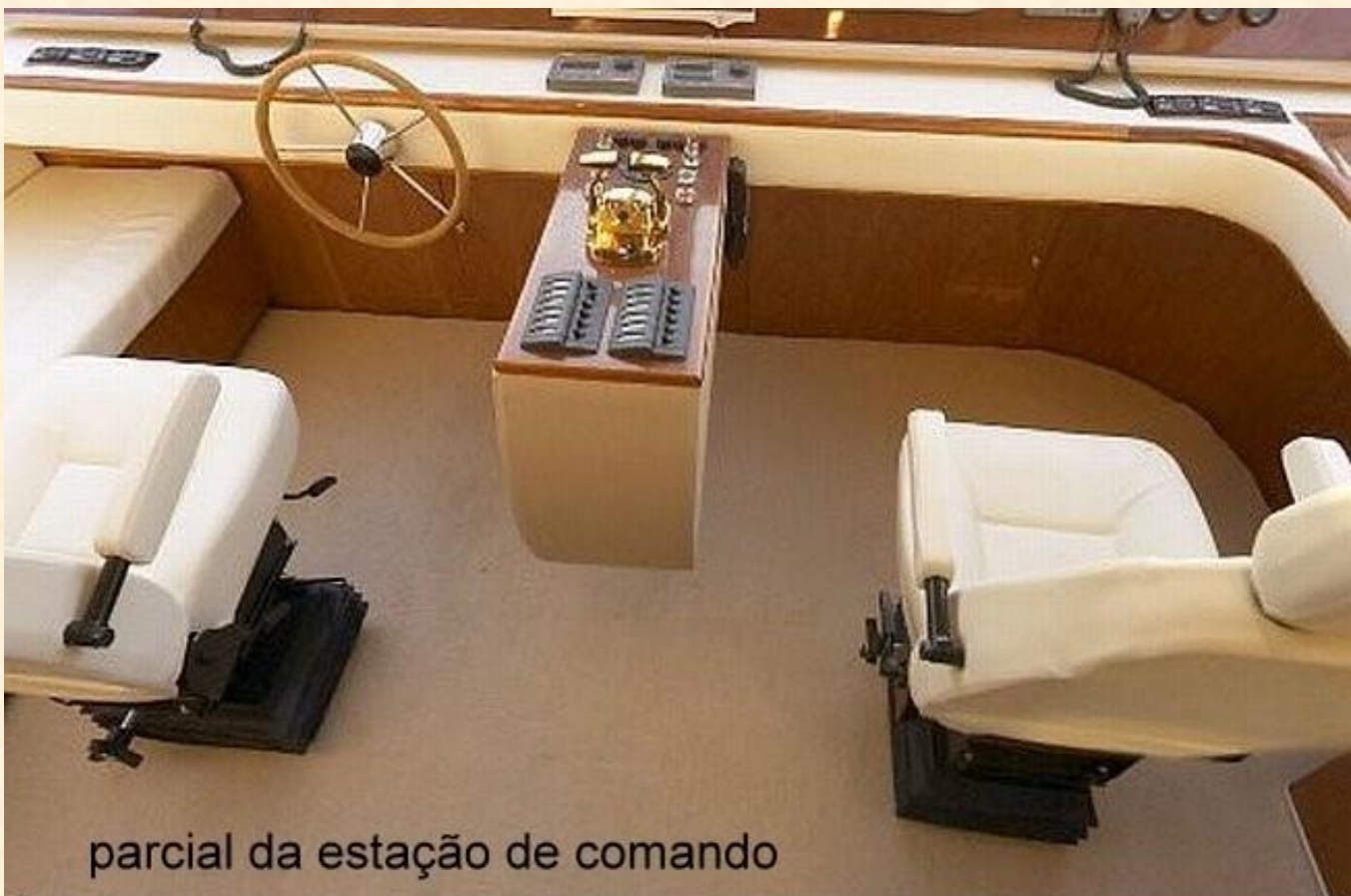
parcial da estação de comando