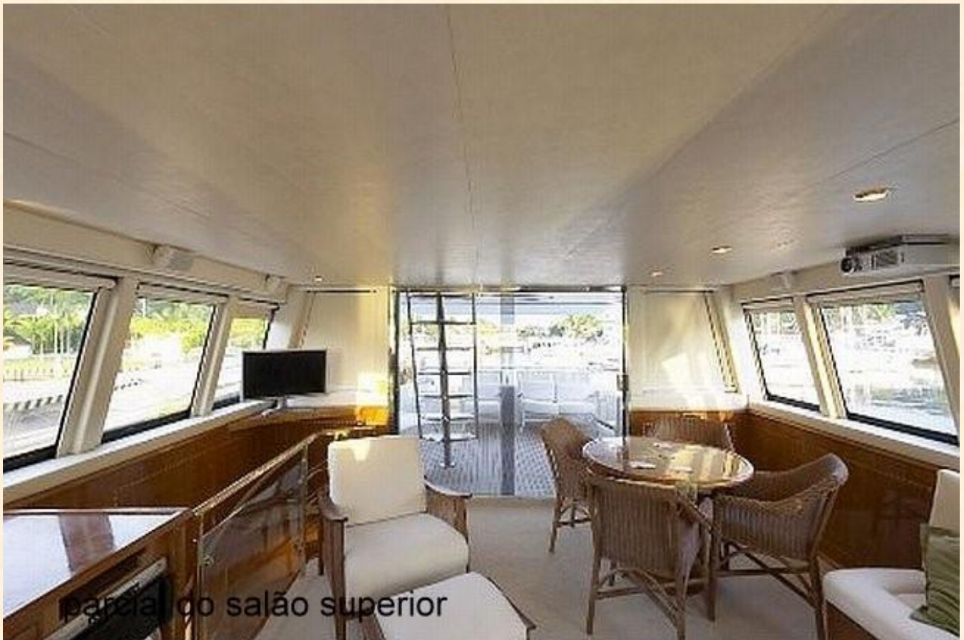
parcial do salão superior