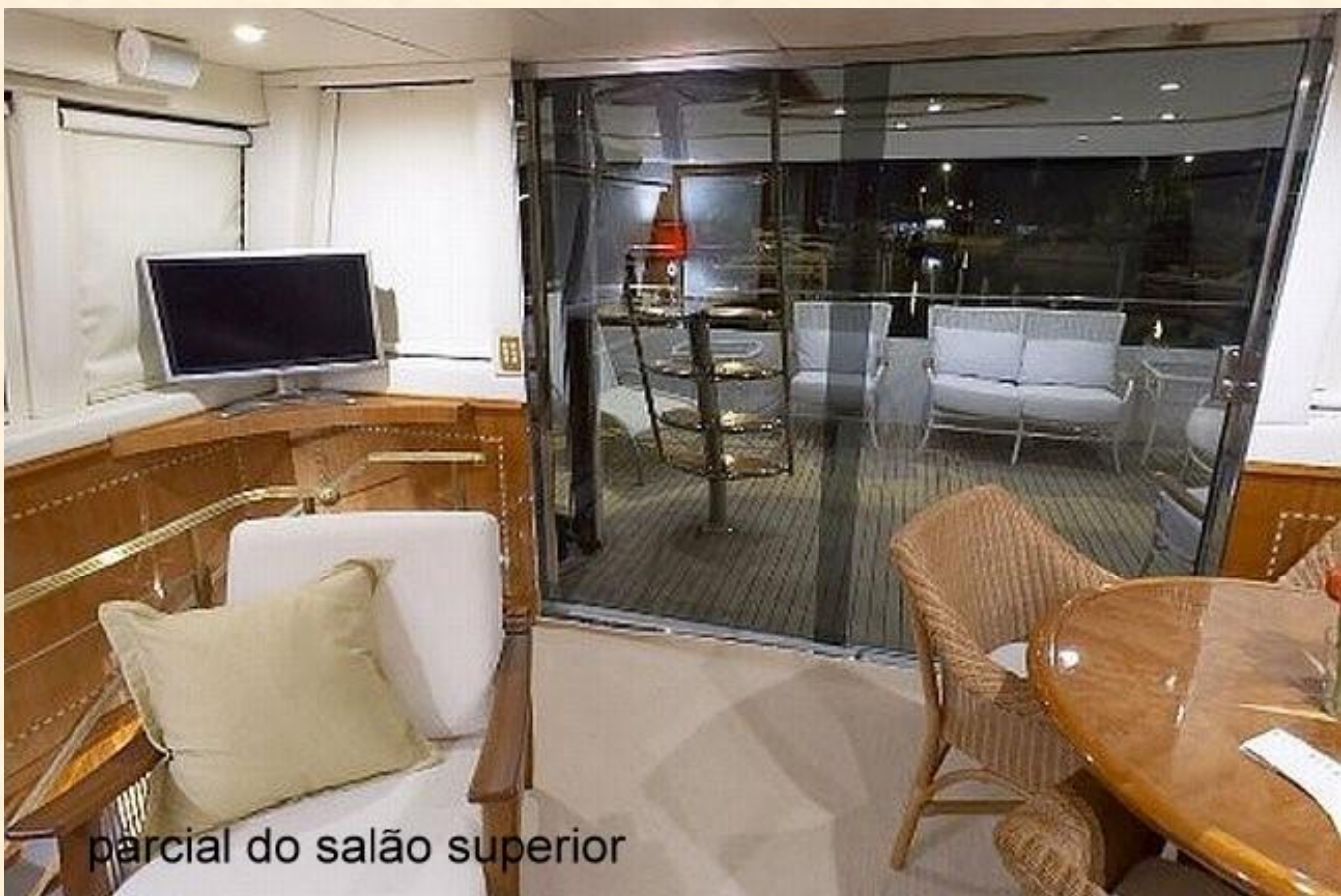
parcial do salão superior