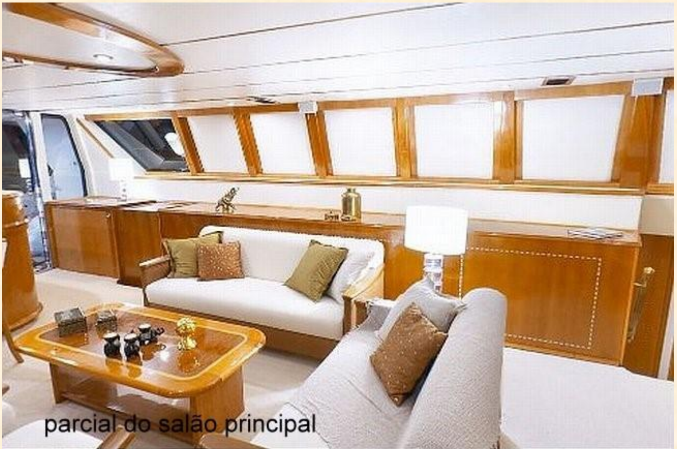
parcial do salão principal