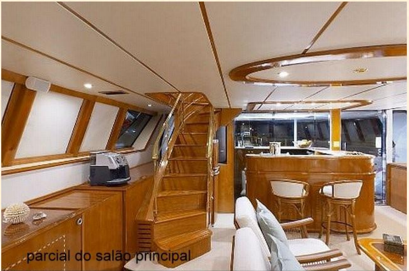
parcial do salão principal