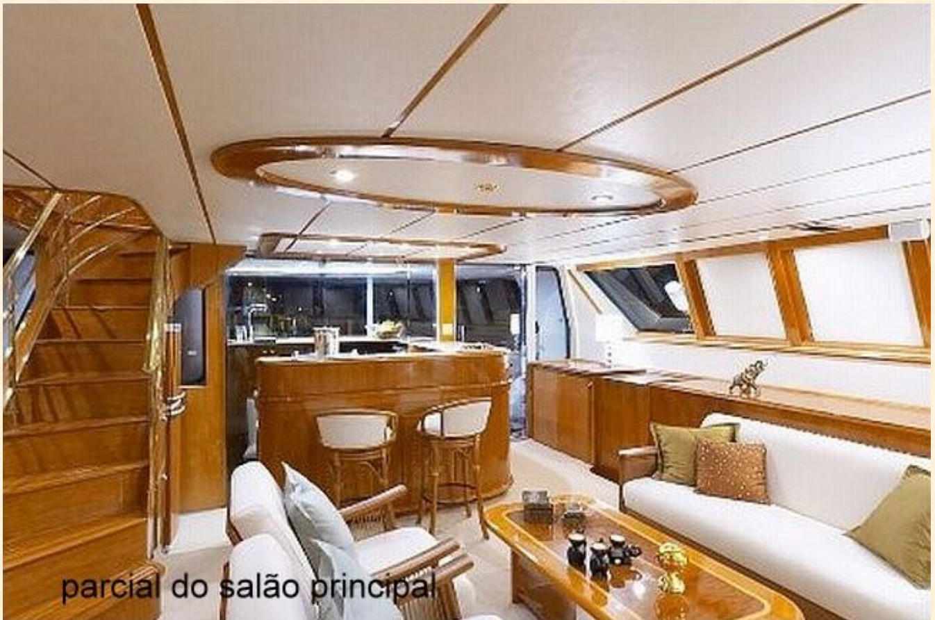
parcial do salão principal