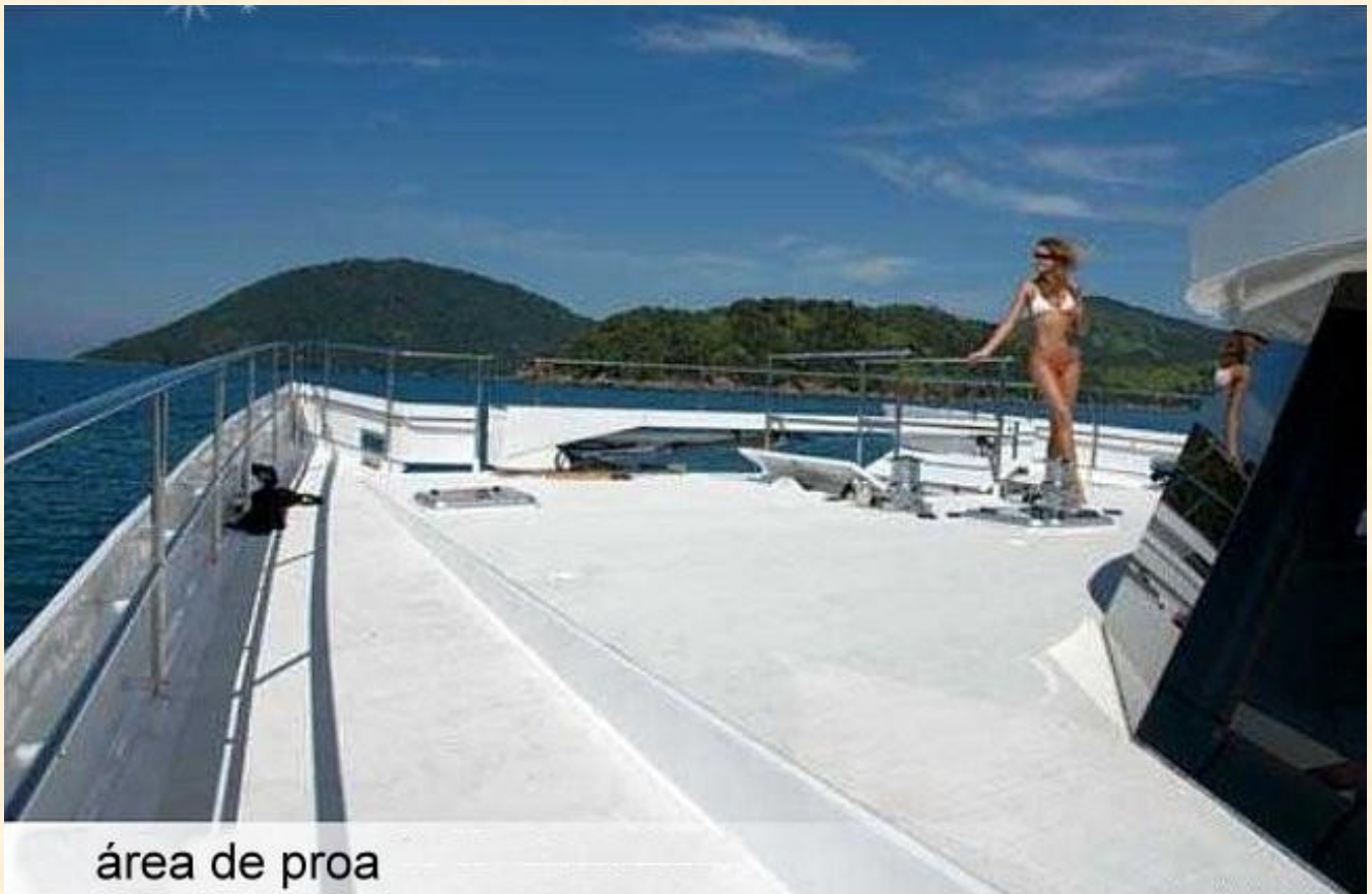
área de proa