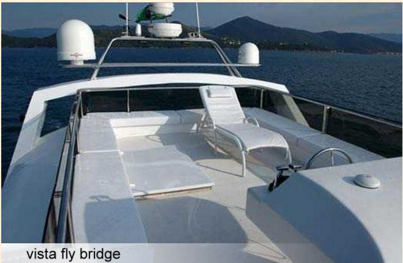
vista fly bridge