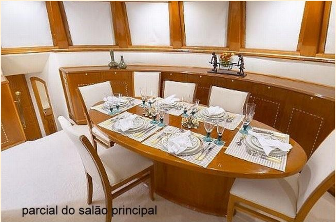
parcial do salão principal