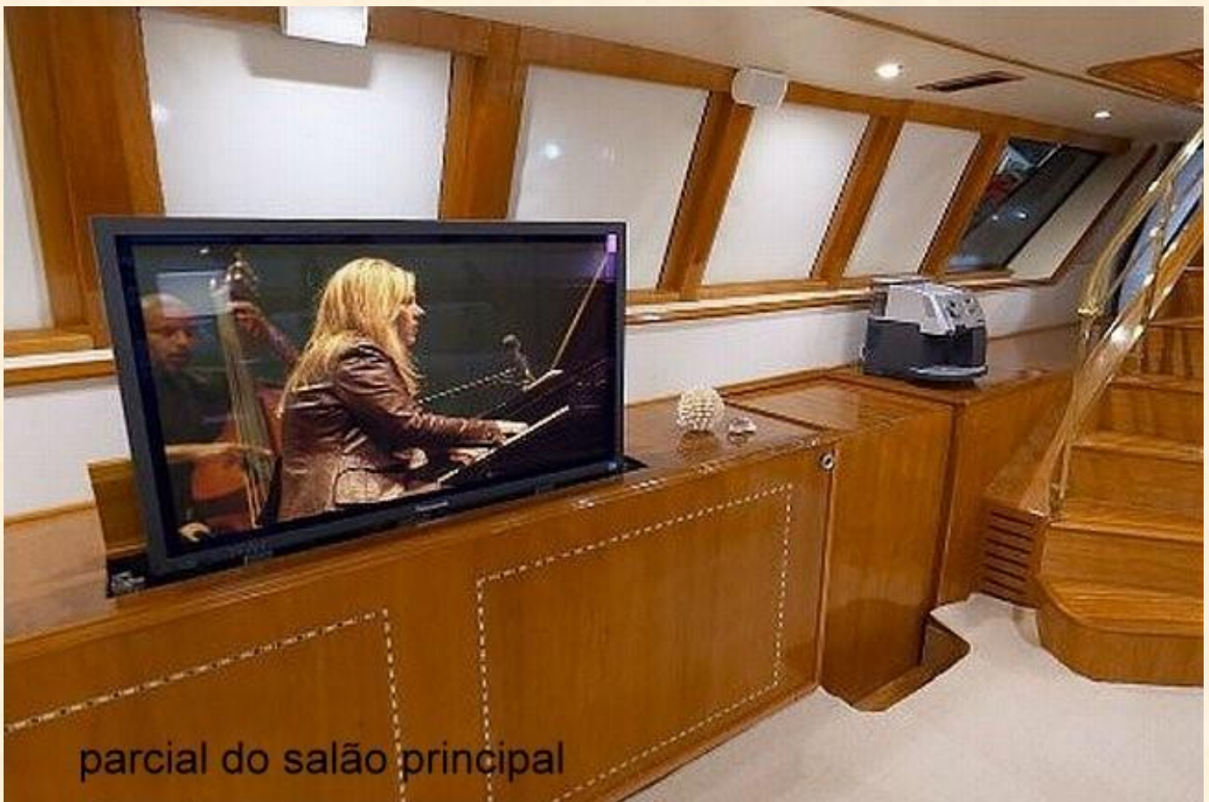
parcial do salão principal