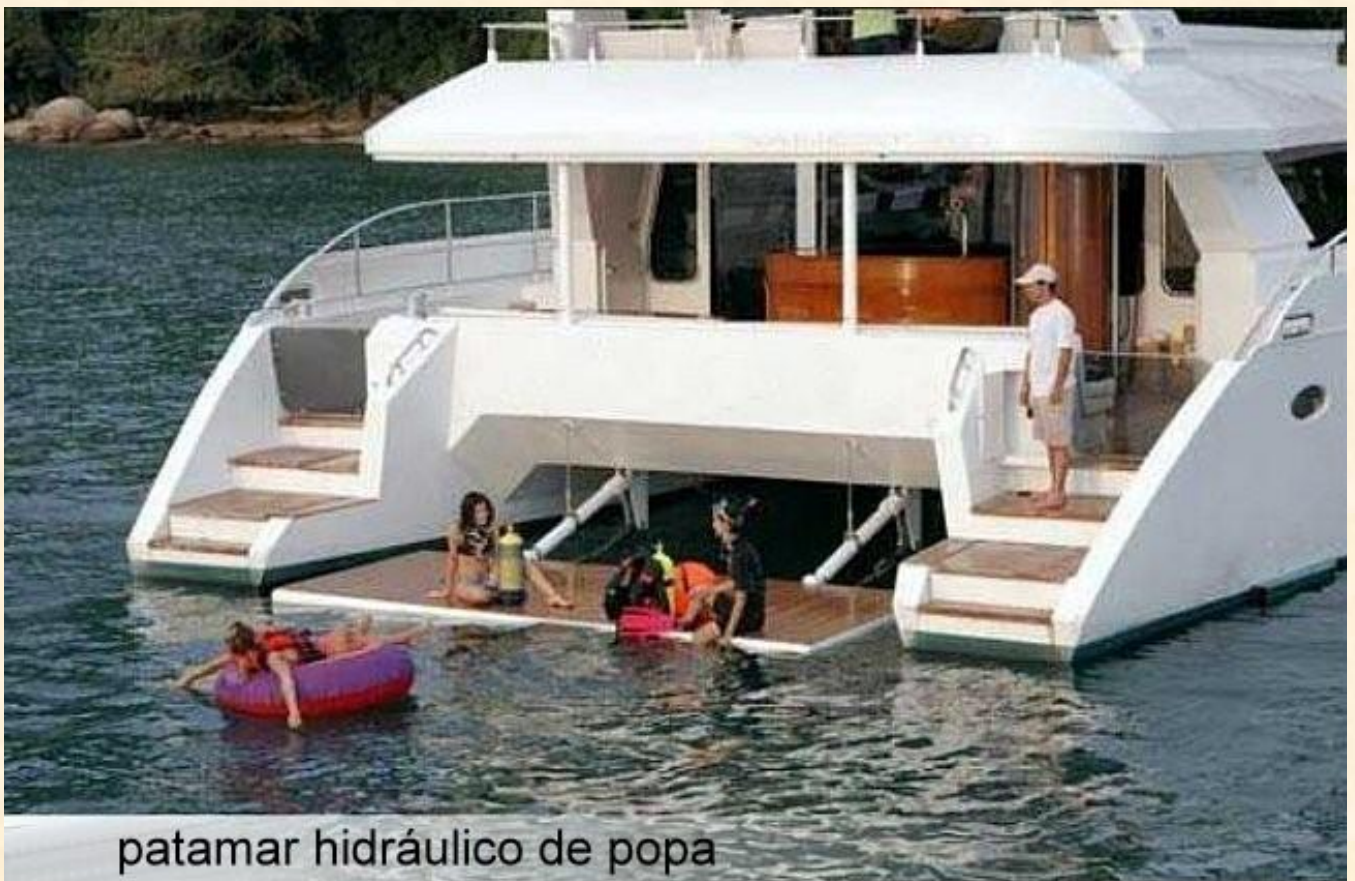
patamar hidráulico de popa