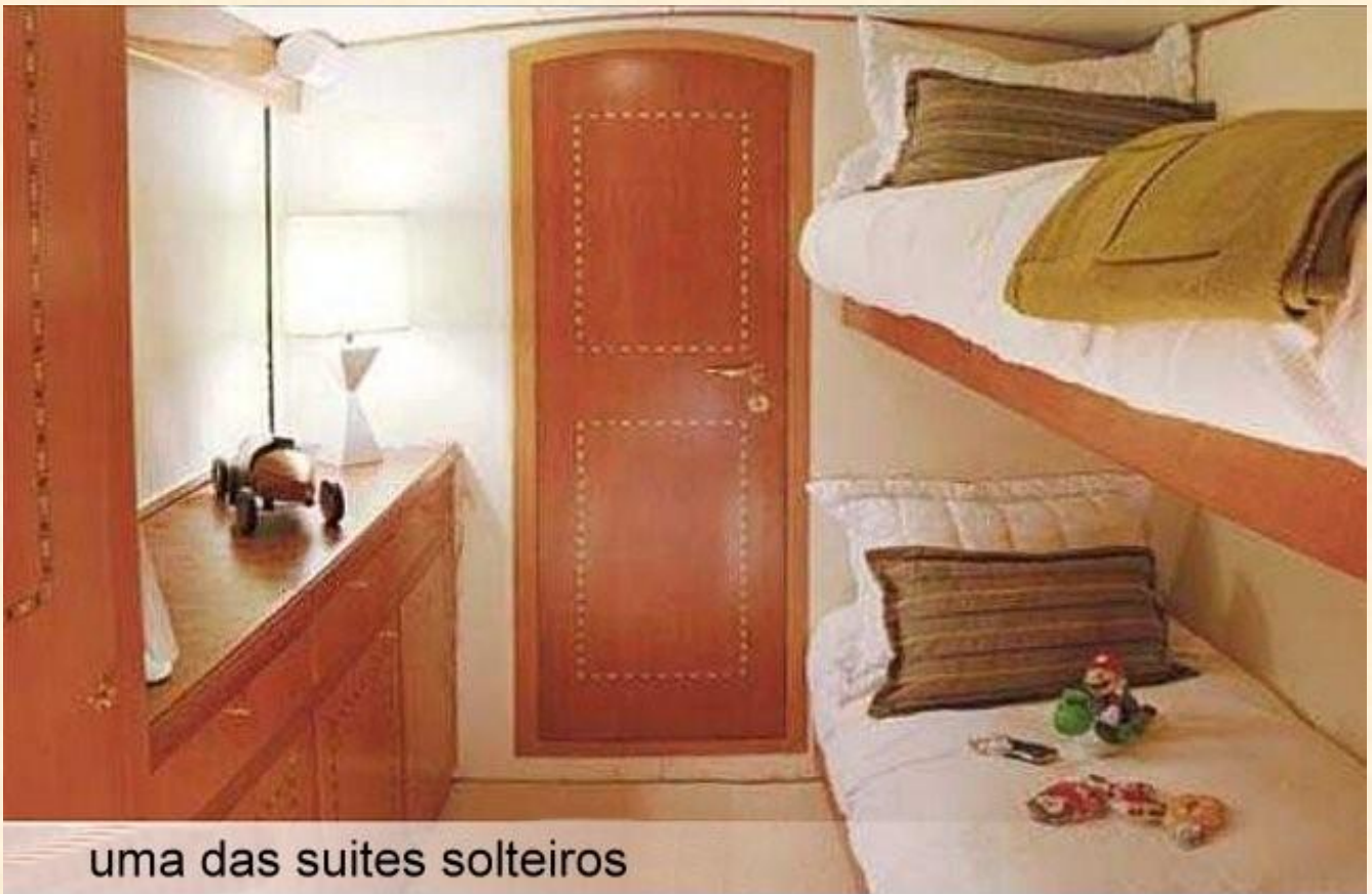
uma das suites solteiros