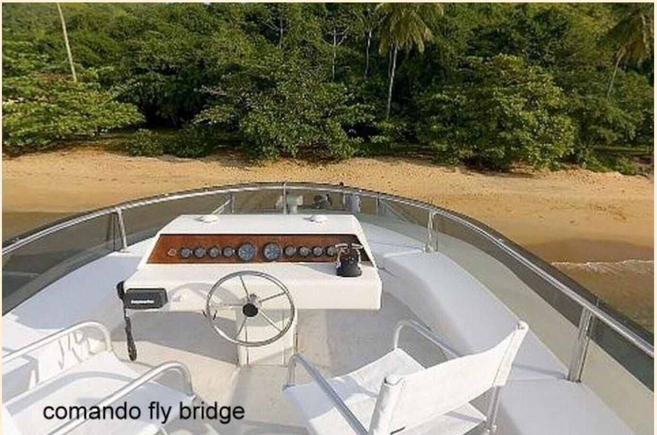
comando fly bridge