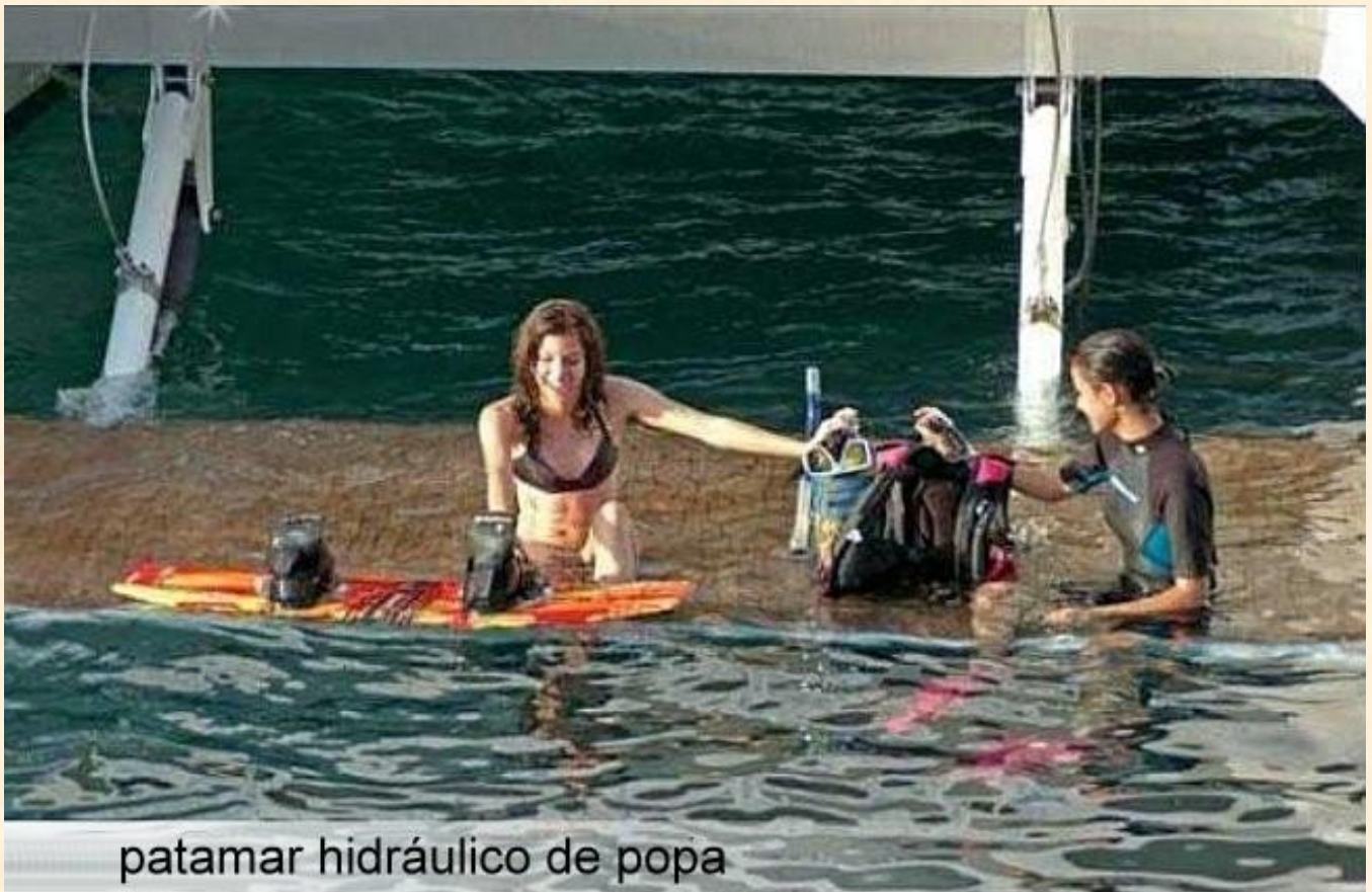
patamar hidráulico de popa