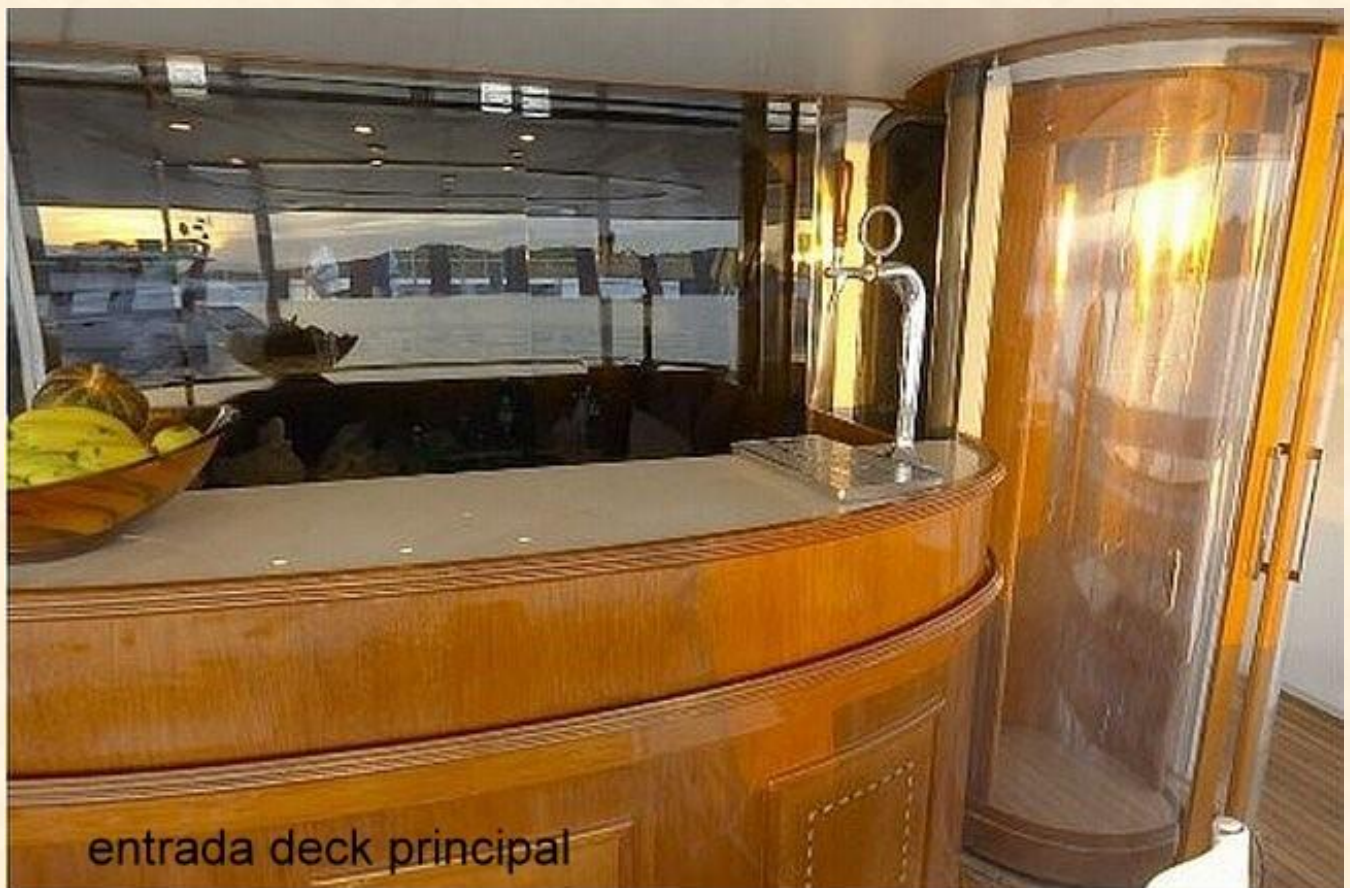
entrada deck principal