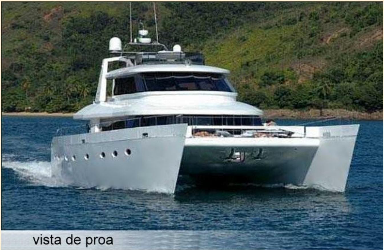
vista de proa